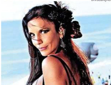
Cantora se apresentou em inauguração de hospital